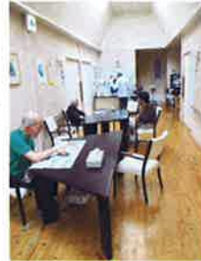
ショートステイ廊下