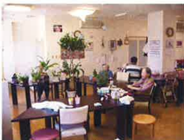
デイサービスフロア