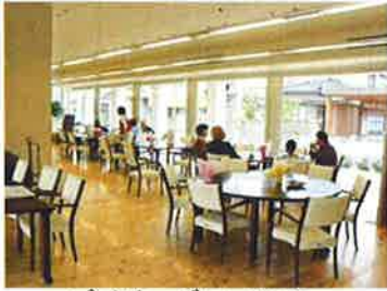
デイサービスフロア

・デイサービス ・ショートステイ ・グループホーム ・訪問介護 ・居宅介護支援事業所