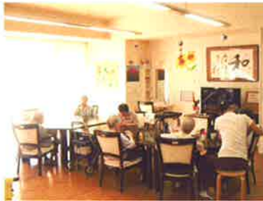
グループホームダイニング